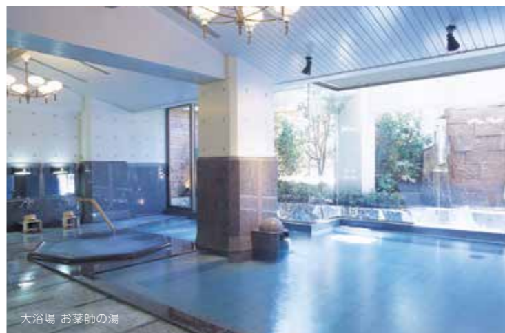
大浴場 お薬師の湯