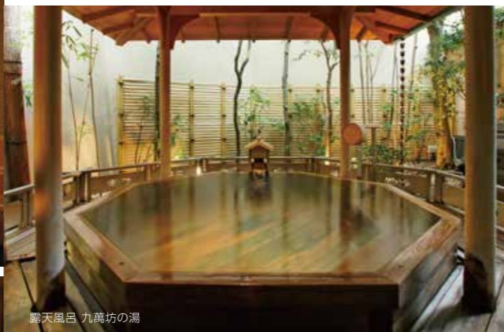
露天風呂 九萬坊の湯